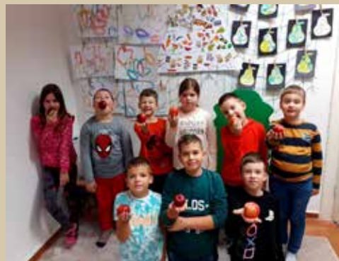
Hovoríme o jedle - jablčko

Školský rok 2022 – 2023 je v plnom prúde. Život školákov v náhradných priestoroch sa rozbiehal pomalšie. Skoré ranné vstávanie, učenie a robenie domácich úloh je režim školáka počas školského roka. Na nové priestory si zvykali deti i my - pani učiteľky. Niektorí žiaci majú na skok do školy a niektorým sa cesta predĺžila. Ale nové priestory sú super. V predsieni sa žiaci prezujú, uložia si svoje topánky do poličky, zavesia bundy a presunú sa do triedy. V triede si nachystajú školské knihy a zošity, peračník a iné pomôcky. Na stene máme osadenú interaktívnu tabuľu, ktorú využívame vo výchovno-vyučovacom procese. Pod oknami máme počítače a pri dverách koberec s poličkou na lego a iné hračky. Každý si našiel svoje miesto a zvykol si naň. Vo vedľajšej miestnosti podáva pani vychovávateľka obedy, ktoré dováža zo Školskej jedálne pri LVS.