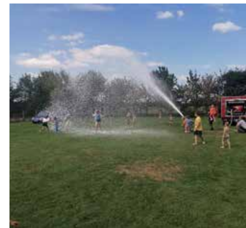
Dážď z hasičskej peny