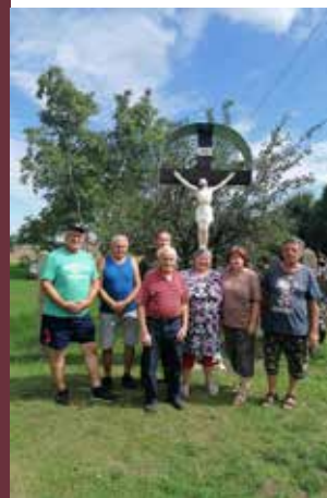
Rodáci z Nového Majera