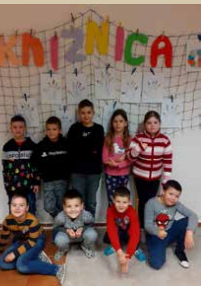
Medzinárodný deň školských knižníc

V mesiaci október od 10.10. do 14.10. nás čakala súťaž HOVORME O JEDLE. V rámci tohto týždňa ochutnali deti rôzne jedlá, hlavne zdravé. V škole sa pekne domáci chliebik v domácej pekární, ktorý spolu s pani vychovávateľkou žiaci nachystali. To bolo výne! A tá chuť obyčajného čerstvého chlebička... Neostala ani omrvinka. Ani deň s ovocím a zeleninou sa nezaobišiel bez chutného ovocného šalátu, ktorý si žiaci nakrájali