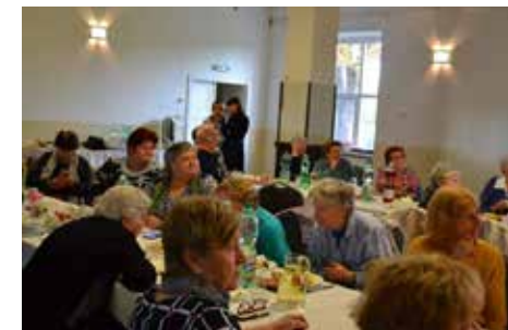
Mesiac úcty k starším