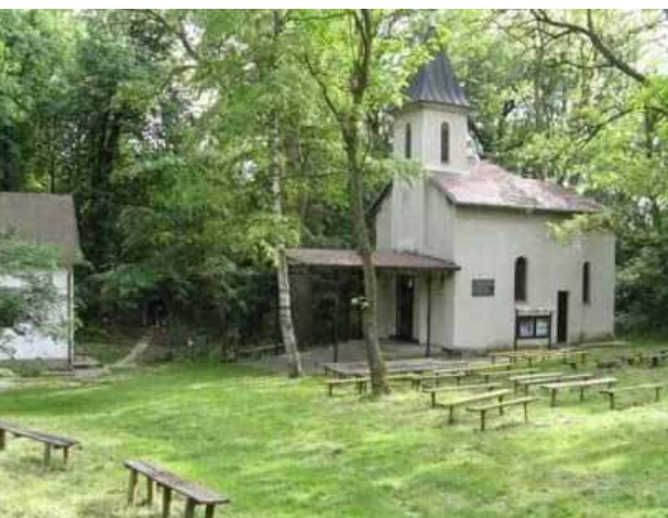
Pútnické miesto Studnička Pozba

Poslednou zastávkou na našej ceste bolo pútnické miesto Studnička Pozba, ktorá sa nachádza medzi obcami Pozba, Bardoňovo a Dedinka. Je zasvätené Sedembolestnej Panne Márii, od mája do konca októbra sa tu pravidelne každú nedeľu slúži svätá omša. Každoročne sa na tomto mieste koná tradičná púť motorkárov, požehnaním motoriek sa otvára motorkárska sezóna. Pri našej návšte-