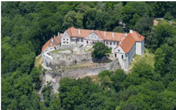
Hrad Modrý Kameň

Poslednú septembrovú sobotu sa konal druhý tohtoročný obecný výlet. Skoro ráno sme autobusom vyrazili smerom na hrad Modrý Kameň. Hrad je múzeom bábkarských kultúr a hračiek dokumentujúcim dejiny a súčasnosť bábkového divadla, detských hračiek ako aj dejín regiónu, v ktorom sa hrad nachádza. Z vystavných exponátov nás zaujali najmä známe televízne posta-